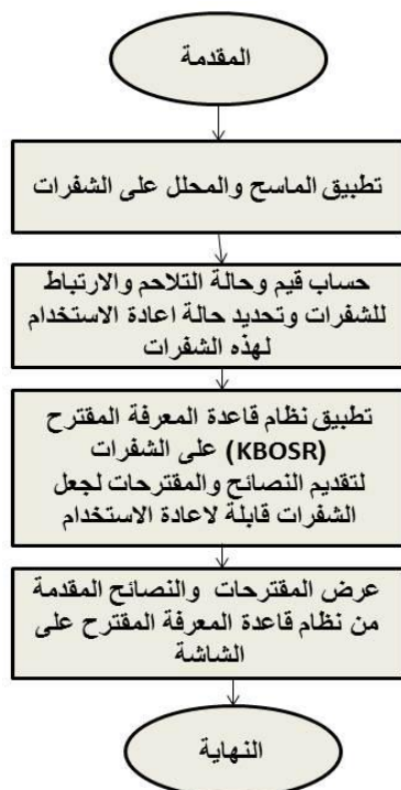
الشكل (2) يوضح خطوات نظام قاعدة المعرفة المقترح (KBOSR)

يوضح الشكل (2) خطوات نظام قاعدة المعرفة المقترح (KBOSR) .